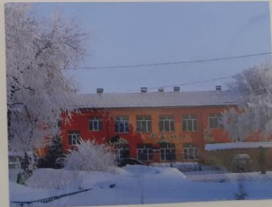
Абатская изба – читальня Была расположена по улице Ленина