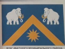
ФЛАГ АБАТСКОГО МУНИЦИПАЛЬНОГО РАЙОНА

ОПИСАНИЕ ФЛАГА. Прямоугольное полотнище с отношением ширины к длине 2:3, несущее на себе избранные фигуры районного герба (сообразный макетом с площадью с 11-ю лучевой звездой) вышитоное белым и желтым цветами. Оборотная сторона аналогична лицевой.