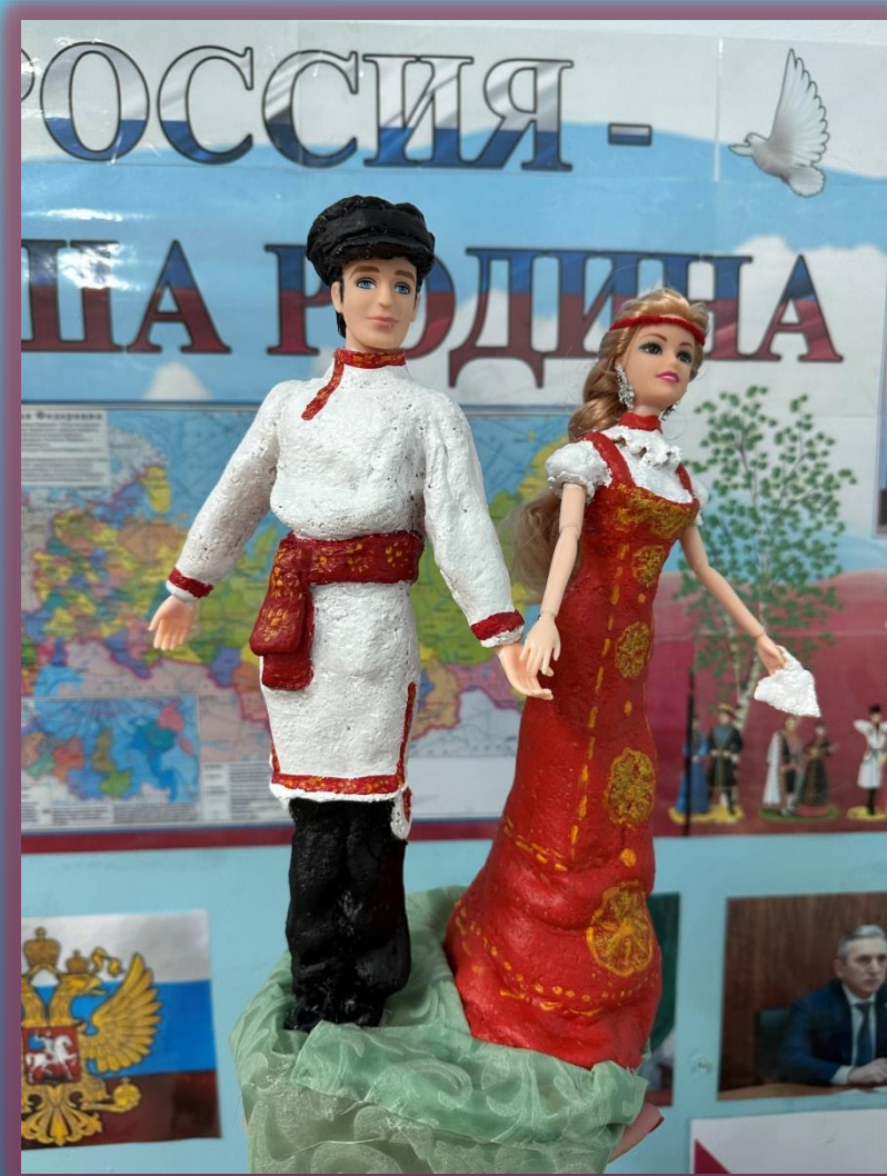
КУКЛЫ В РУССКИХ НАРОДНЫХ КОСТЮМАХ