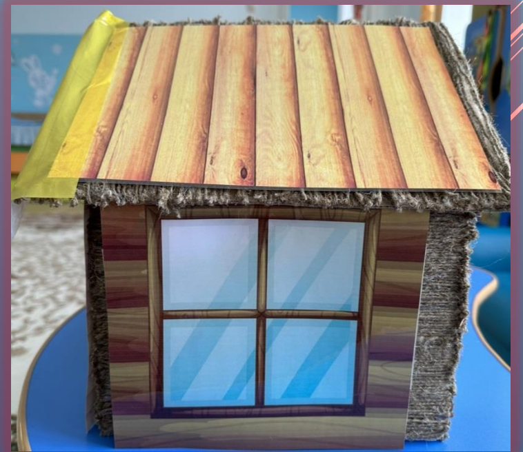
МАКЕТ «РУССКАЯ ИЗБА» (НА ЛИПУЧКАХ)