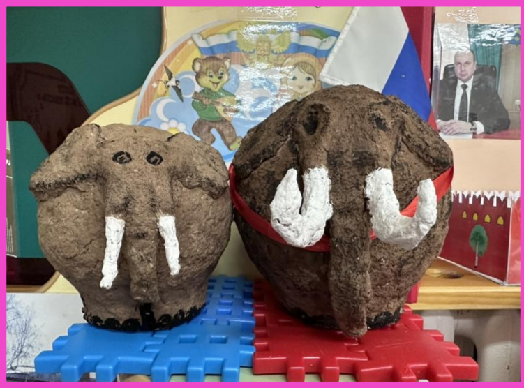
ПАМЯТНИКИ: «ПАТРИОТ», «МАМОНТ», «МАМОНТЁНОК».